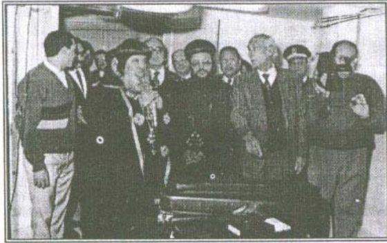
قداسة البابا ونيافة الأنبا مرقس في افتتاح مستشفى سانت ماري

لم تقتصر خدمة نيافته ورؤيته لحاجة المرضى إلى الأدوية فقط أو المساعدات المالية فقط بل توسعت الرؤية إلى إنشاء صرح طبي وهو مستشفى سانت ماري..