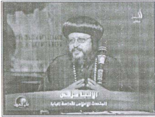
نيافة الأنبا مرقس في مناظرة مع ماكس ميشيل (قناة أوربت)

دأبت الفضائيات ومنها علي سبيل المثال (أوربت، دريم، الجزيرة، النيل) وكذلك قنوات التليفزيون المصري (القناة الثالثة، قناة التنوير، قناة النيل الثقافية) منذ عدة سنوات على دعوة نيافة الأنبا مرقس للتحدث في الأعياد والمناسبات الكنسية وكذلك للرد على الاستفسارات الخاصة بعقيدة الكنيسة القبطية، وقد ظهرت جلياً لغته الحوارية وبلاغته في ملفات و قضايا عديدة منها ملف ماكس ميشيل ومشكلة وفاء قسطنطين وإصدار المطرانية لبيان واضح ومباشر، وقضية الرسوم المسيئة وخطاب البابا بندكت وحيث أوصى نيافته بالحرص على مشاعر الآخرين ومنهج المحبة في قبول الآخر،