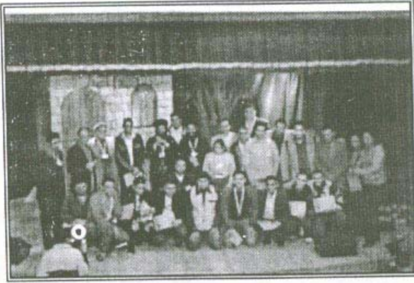
حفل ختام الدورة التدريبية الأولى لفنون المسرح ٢٠٠٦

يعتبر نيافة الأنبا مرقس رائداً في مجال الأنشطة الفنية عامة والمسرح بصفة خاصة، ولذا أنشاء نيافته مسرحاً في أوائل الثمانينات مجهزاً بأحدث الإمكانات والتقنيات الفنية الملائمة للعمل المسرحي فهو يماثل المسارح العامة وواحد من أرقى المسارح داخل الكنائس ولاهتمام نيافته بالإبداع الفني أرسى قواعد للفنون من كورال ومسرح خلال مهرجانات تعد الأولى في الفكر منذ ثلاثة عشر عاماً أخذتها المهرجانات الوليدة وسارت على نهجها وكان لفكر نيافته في إقامة هذه المهرجانات الأثر الكبير في نضج أبناء الإيبارشية فنياً ومسرحياً فهي