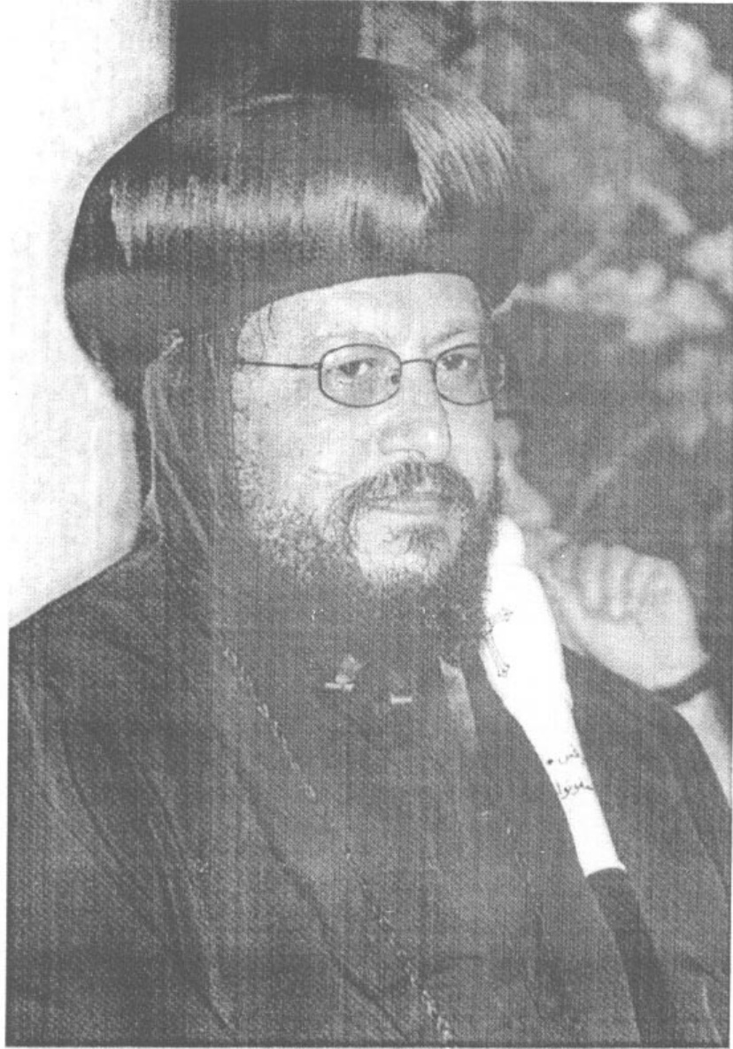
نيافة الحبر الجليل الأنبا مرقس أسقف شبرا الخيمة وتوابعها