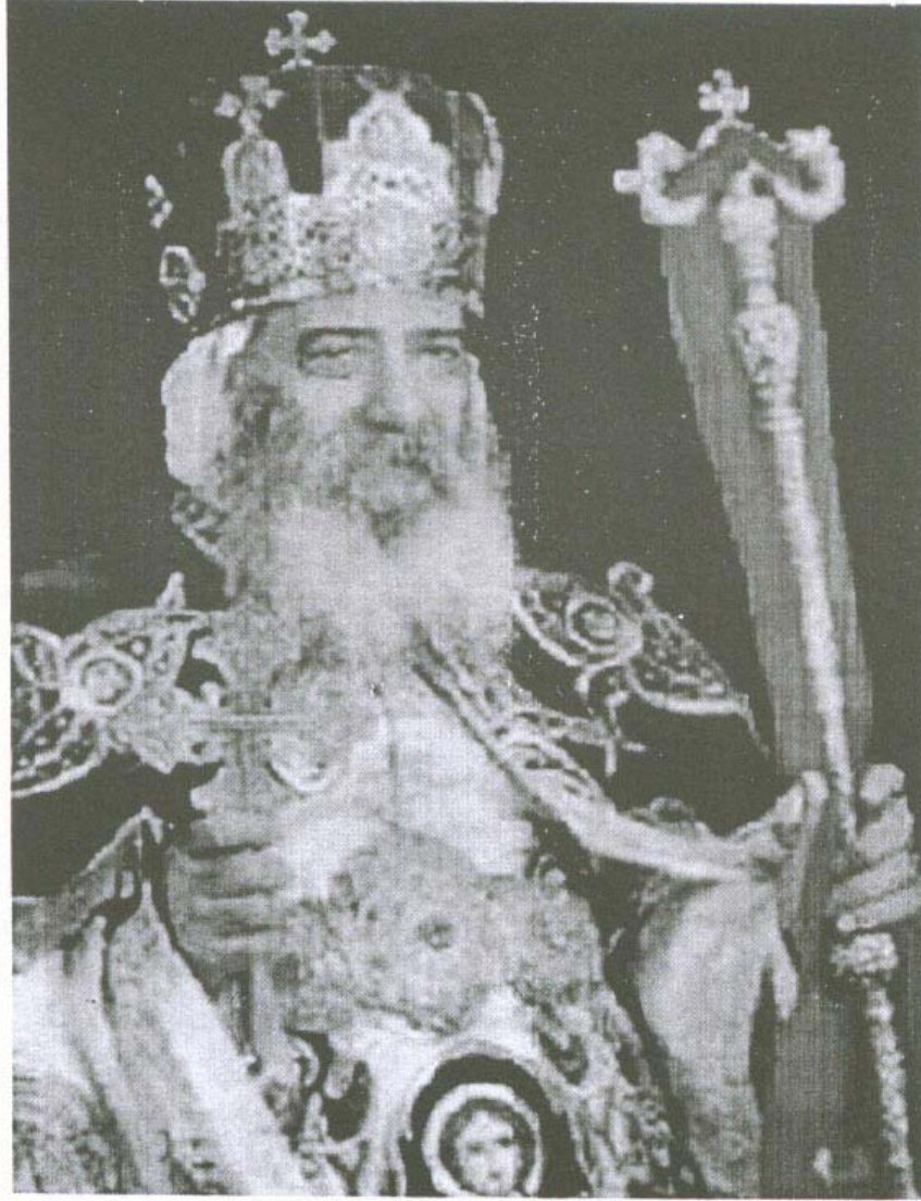
قداسة البابا المعظم الأنبا شنودة الثالث بابا الإسكندرية وبطريك الكرازة المرقسية