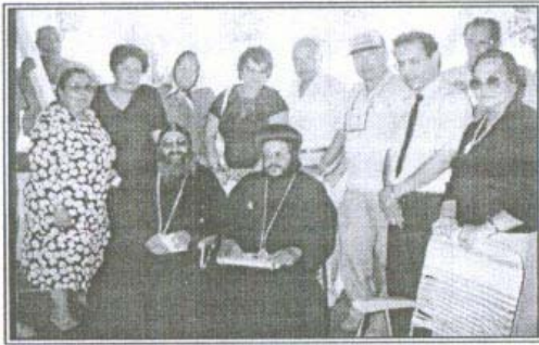
نيافة الأنبا مرقس نائب بابوي لكنائس استراليا

ونظراً لثقة قداسة البابا شنودة الثالث في نيافته فقد كلفه وهو في رحلته العلاجية بالقيام بمهمة المتحدث الرسمي للكنيسة القبطية ولقداسة البابا شنودة الثالث وللرد على ماكس ميشيل خاصة حيث قام نيافته بتفنيد بدعته واثبات أنه لا أساس لرسامته وأسقيته حيث أن المجمع الذي رسمه هو مجمع منشق عن الكنيسة البيزنطية، وقد قام نيافته بتدعيم حديثه بالوثائق التي معها هرب ماكس ميشيل من المناظرة وعدم التحدث في وجود نيافته مرة أخرى.