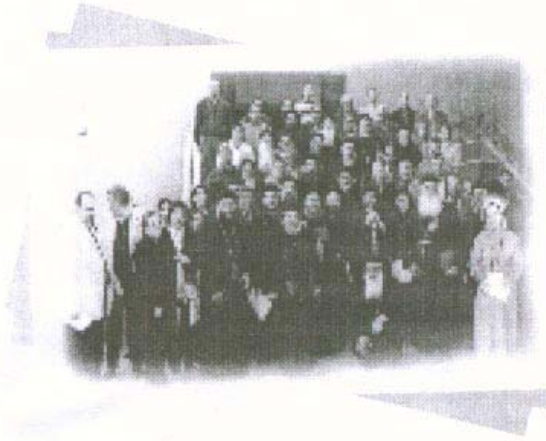
أحد المؤتمرات الدورية لمركز التنمية