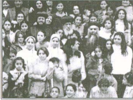
مع دار العذراء في زيارة قداسة البابا

عدهن الآن خمسون فتاة يتمتعن بكل الرعاية الروحية والجلسات الأبوية مع نيافته مع حفظ المزامير وقطع الأناجيل والأجبية، كما تتمتع فتيات الدار أيضا بالرعاية الصحية والتربوية والتعليمية من حضنة حتى التخرج من الجامعة، وقد قام الدار بتزويج خمس وثمانين فتاة بتجهيزات راقية واشترى الدار قطعة أرض ملاصقة له وذلك لإجراء توسعات لاستيعاب أعداد أكثر.