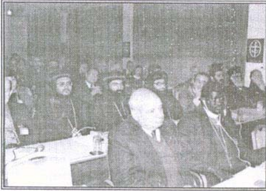
نيافة الأنبا مرقس في لقاء مجلس كنائس الشرق الأوسط