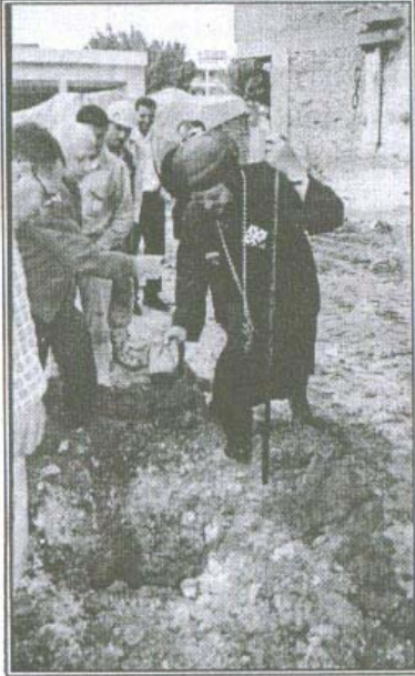
الاسقف محب التعمير في تأسيس مبني سان جورج

ولم يكتف نيافته بهذا، حيث اهتم بشراء قطعة أرض أخرى خلف مبنى المطرانية مباشرة وتعتبر امتداد لمبنى دار الفتيات ومساحتها ٢٠٠ متر.