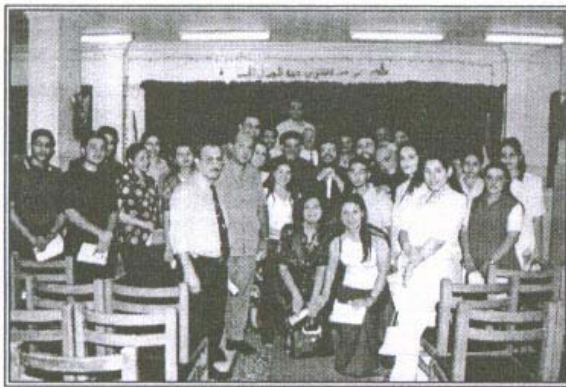
نيافة الأنبا مرقس يتوسط فصل إعداد خدام المرضى بالإبيارشية

دور هائل رسمه نيافته من تنظيم قوافل تجوب كنائس الإبيارشية للخدمات الصحية... ثم تطورت الفكرة بإنشاء: